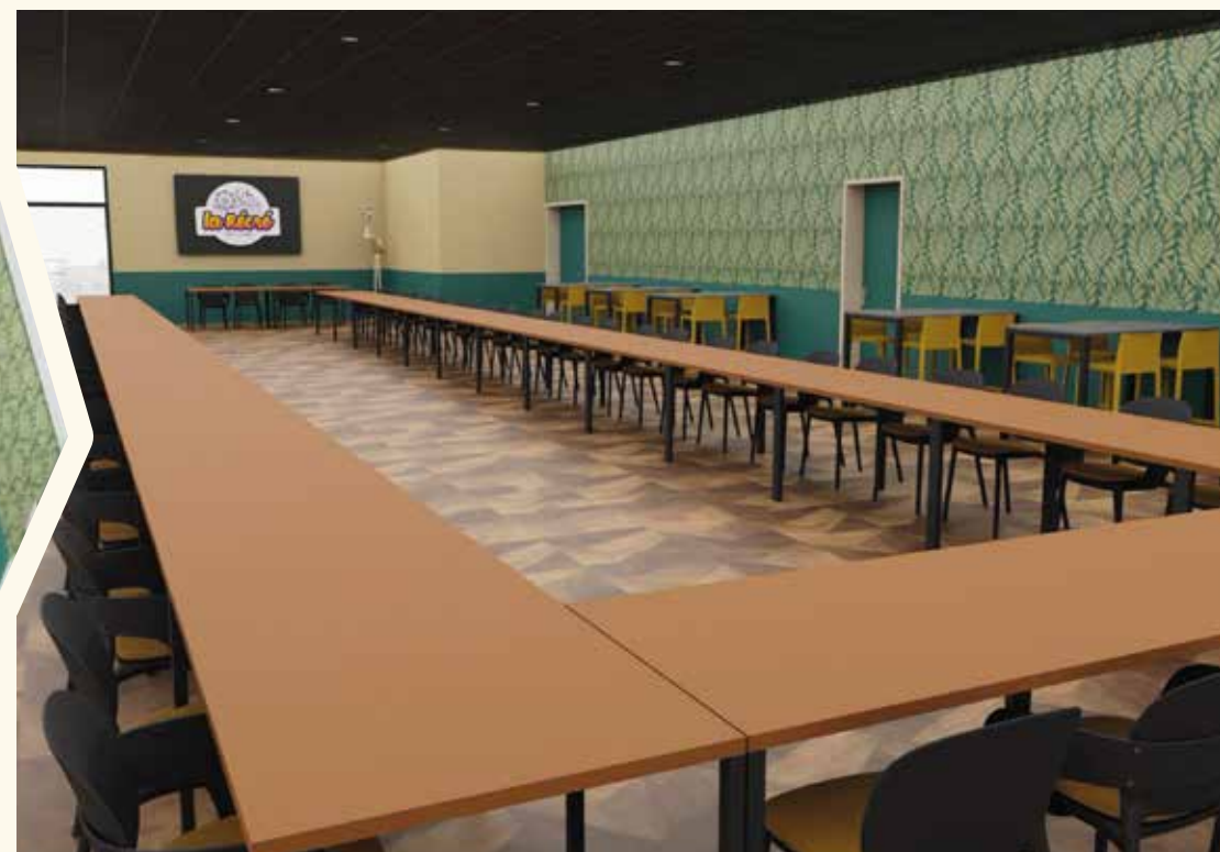
Configurations possibles dans la salle Pavillon 1900