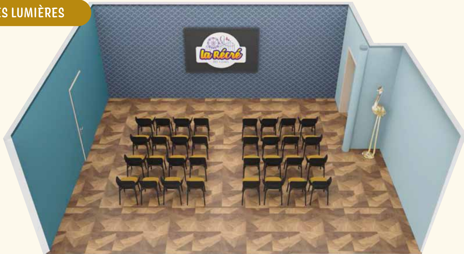
Configurations possibles dans la salle Pavillon 1900