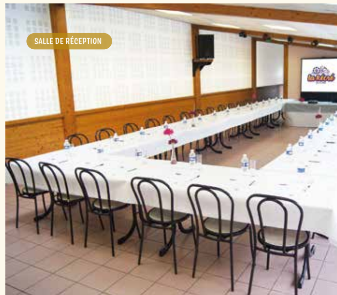
SALLE DE RÉCEPTION

LA SALLE DE RÉCEPTION, située dans le parc, peut accueillir jusqu'à 250 personnes.