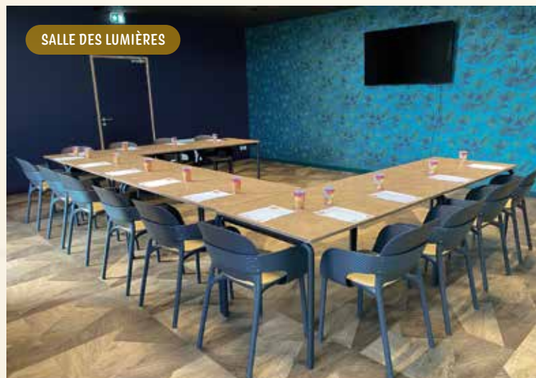
SALLE DES LUMIÈRES