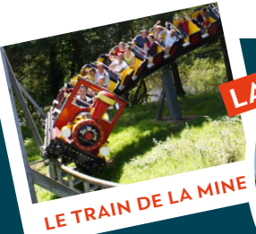
LE TRAIN DE LA MINE