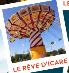
LE RÊVE D'ICARE