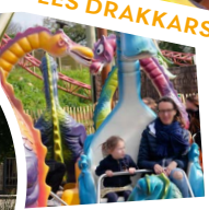
LE PEN DRAÏG

Préparer votre visite selon vos envies de sensations !