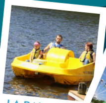
LA BALADE SUR LE LAC