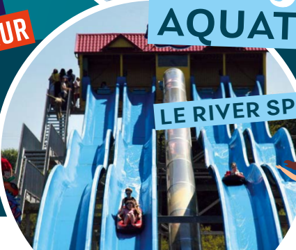
LE RIVER SPLASH